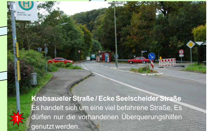
Krebsauer Straße / Ecke Seelscheider Straße Es handelt sich um eine viel befahrene Straße. Es dürfen nur die vorhandenen Überquerungshilfen genutzt werden.