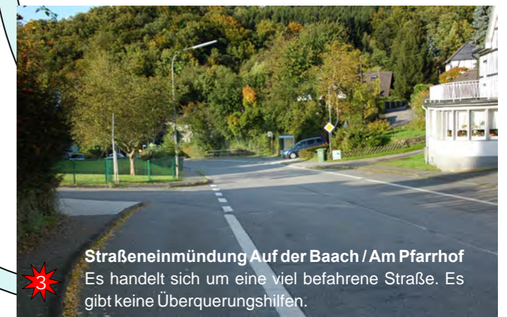
Straßeneinmündung Auf der Baach / Am Pfarrhof Es handelt sich um eine viel befahrene Straße. Es gibt keine Überquerungshilfen.