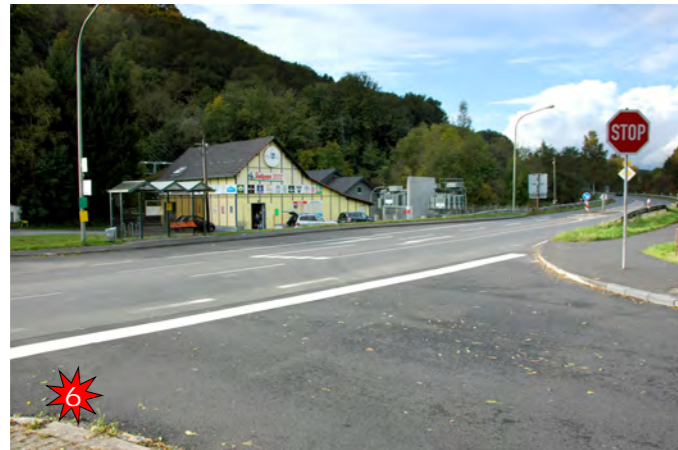
Haltestelle an der B 484 Die PKW's fahren an dieser viel befahrenen Straße mit hoher Geschwindigkeit. Die Überquerungshilfe muss genutzt werden.