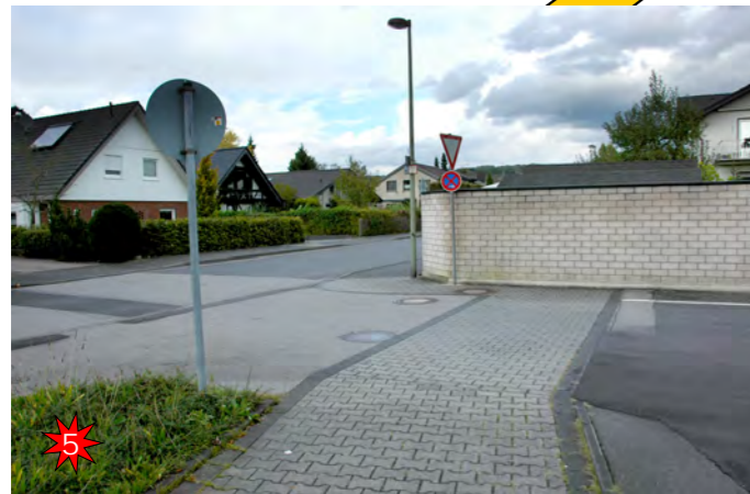
An der Schule / Ecke Parkplatz Hohes PKW-Aufkommen, da viele Schüler mit dem PKW oder dem Bus zur Schule kommen. Auf dem Parkplatz entlang führenden Gehweg darf nicht gehalten oder geparkt werden. Die markierten Parktaschen sind zu nutzen. Aufgrund einer Mauer können Fußgänger den Parkplatz von der Krebsauer Straße aus nur sehr schlecht einsehen.