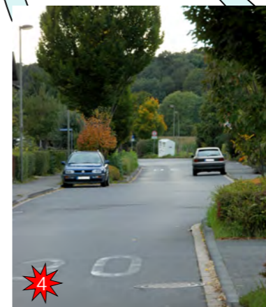
Krebsauer Straße Hier ergibt sich aufgrund der auf der Straße parkenden PKW's ein Gefahrenpunkt für Radfahrer. Auf dem Rückweg von der Schule muss auf die Rechts- vor Links-Regelung geachtet werden.