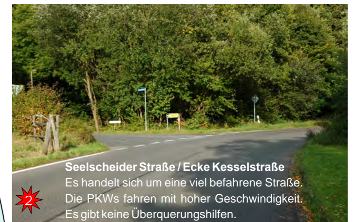
Seelscheider Straße / Ecke Kesselstraße Es handelt sich um eine viel befahrene Straße. Die PKW's fahren mit hoher Geschwindigkeit. Es gibt keine Überquerungshilfen.